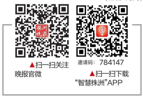
▲扫一扫关注 晚报官微