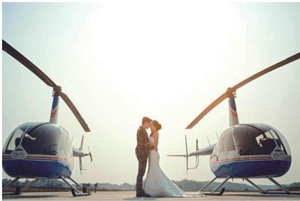
▲飞行婚礼(资料图片) 翔为通航供图

明日七夕。在这个充满爱的日子里,你打算如何用最别致浪漫的方式度过?昨天,记者从湖南翔为通用航空有限公司了解到,该公司将在七夕这天举办一场“天空之约,为爱升舱”的特别活动,为全株洲的俊男靓女们,提供一场最浪漫的七夕约会。