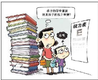
张颖敬重? 李敬 作