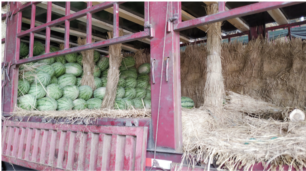
▲昨日上午,金三角水果批发市场内,被偷运走的西瓜追回来了