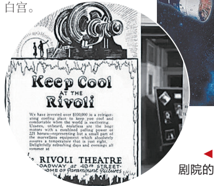
▲当时里沃利大剧院的广告(资料图)

那一天,到里沃利大剧院看电影的人都带着把纸扇以防万一。跨入剧院大门的一刹那,如风般清凉彻底征服了观众。使用空调的里沃利大剧院大受欢迎。不仅是剧院,百货商场里也装上了空调,20世纪20年代,美国梅西百货安装开利空调,为顾客提供舒适的购物环境。空调自此进入了迅猛发展的阶段,并进入白宫。