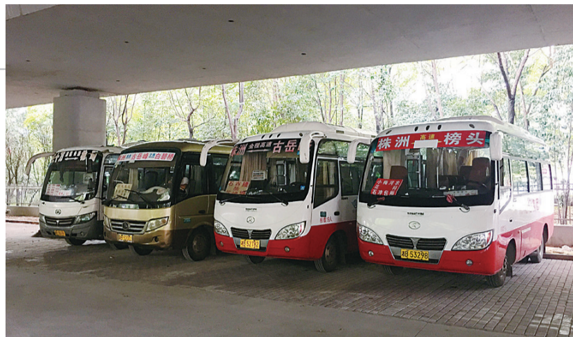
▲停靠在天元大桥下的客运中巴