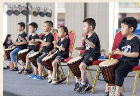
▲“市民大课堂”汇报演出现场,小朋友们进行非洲鼓表演