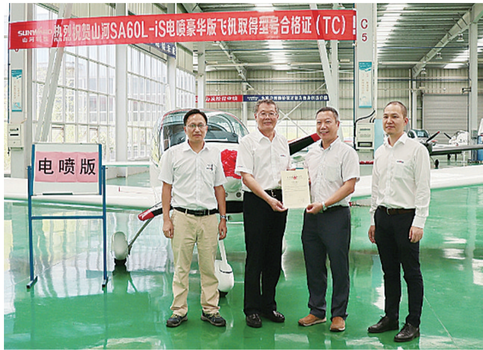
▲山河SA60L-is电喷豪华版飞机获颁型号合格证

本报讯(记者 周嵩 通讯员 刘鹏飞)“株洲造”通航飞机再添新机型。7月31日,山河SA60L-is电喷豪华版飞机成功取得型号合格证(TC)。这标志着该机型将正式投入市场,满足客户定制化需求。