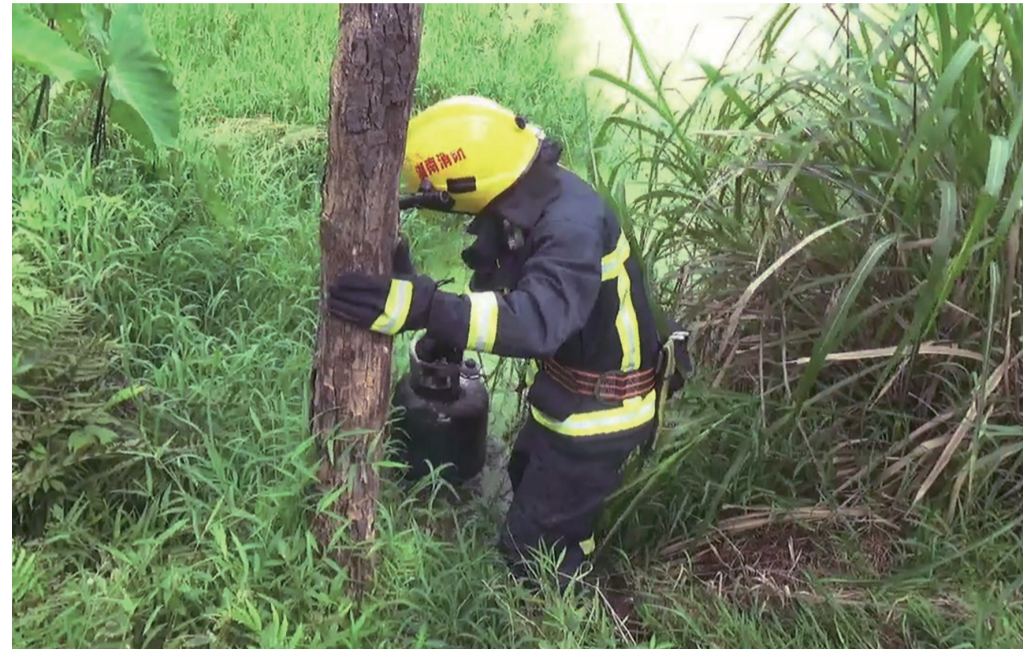
▲消防员将液化气罐放进水沟冷却

据了解,瓶装液化气的价格从原来的77元/瓶涨到87元/瓶。此外,每瓶液化气的保险费为2元,需要送气到户的,另外收取送气费7元/瓶。