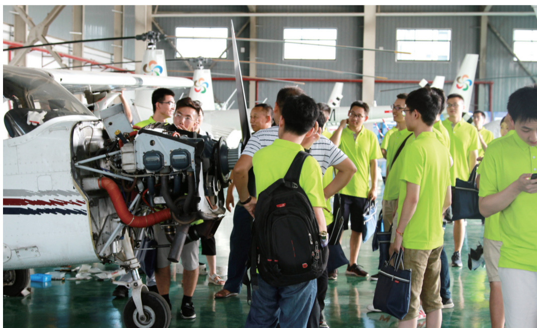
▲参加“启航·芦淞”实践活动的大学生在参观通用机场

攸县的“实训攸州”大学生主题实践活动阵势更大,实践岗位涉及机关、企业、乡镇等。攸县县委人才办介绍,根据安排,每人实践期应不低于1个月。今年报名的高校学生已有483人,有352人已到位开始实践活动。其中研究生有140多名,博士生6名。