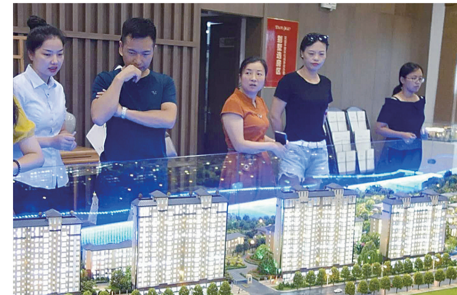
▲高科·万丰上院营销中心,市民在看房(资料图)

有楼盘置业顾问表示,天气炎热,眼下正值市场淡季,清凉类型的活动除了为楼盘增添人气,也能够促进观望情绪的化解,提升成交几率。另外,也有业内人士表示,现在也是孩子们的暑假时节,以“孩子+清凉”来策划主题活动,一方面可以让小区业主的孩子在暑假有合适的去处,又能增加家庭之间的互动,同时也间接为楼盘的品牌形象加分。