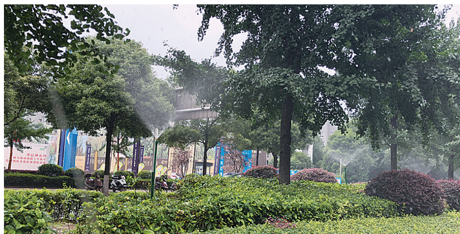
▲庐山路沿线的绿化喷灌设施

园林专家也提醒市民,高温天,自家养的花花草草也要注意防晒。一是切莫在中午、下午太阳暴晒的时候浇水;二是像兰花、牡丹等喜阴植物,可以移入室内,但千万不要让它们吹空调降温。