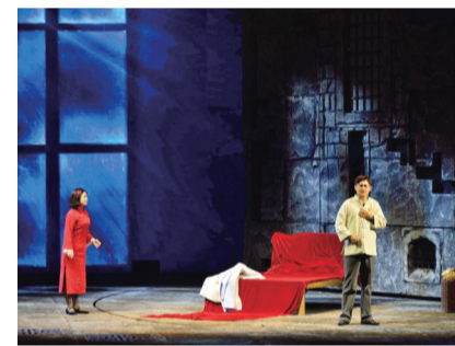
▲株洲原创大型民族歌剧《英雄》在神农大剧院演出(资料图)

文化是城市最好的底色。湘江河畔的株洲,因为文化而韵味十足。自2015年7月,株洲市成功取得第三批国家公共文化服务体系示范区创建资格,文化设施建设成为了成功创建的首要硬件条件。3年间,从气势恢宏的神农大剧院,到艺术气息浓厚的市博物馆、美术馆;从家门口的文化馆,到村头的图书室,株洲市县乡村四级文化设施建设加快步伐,硬件设施提档升级,让市民的文化生活更加多姿多彩。