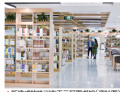
▲新建成的株洲市天元区图书馆(资料图) 记者 刘震 摄