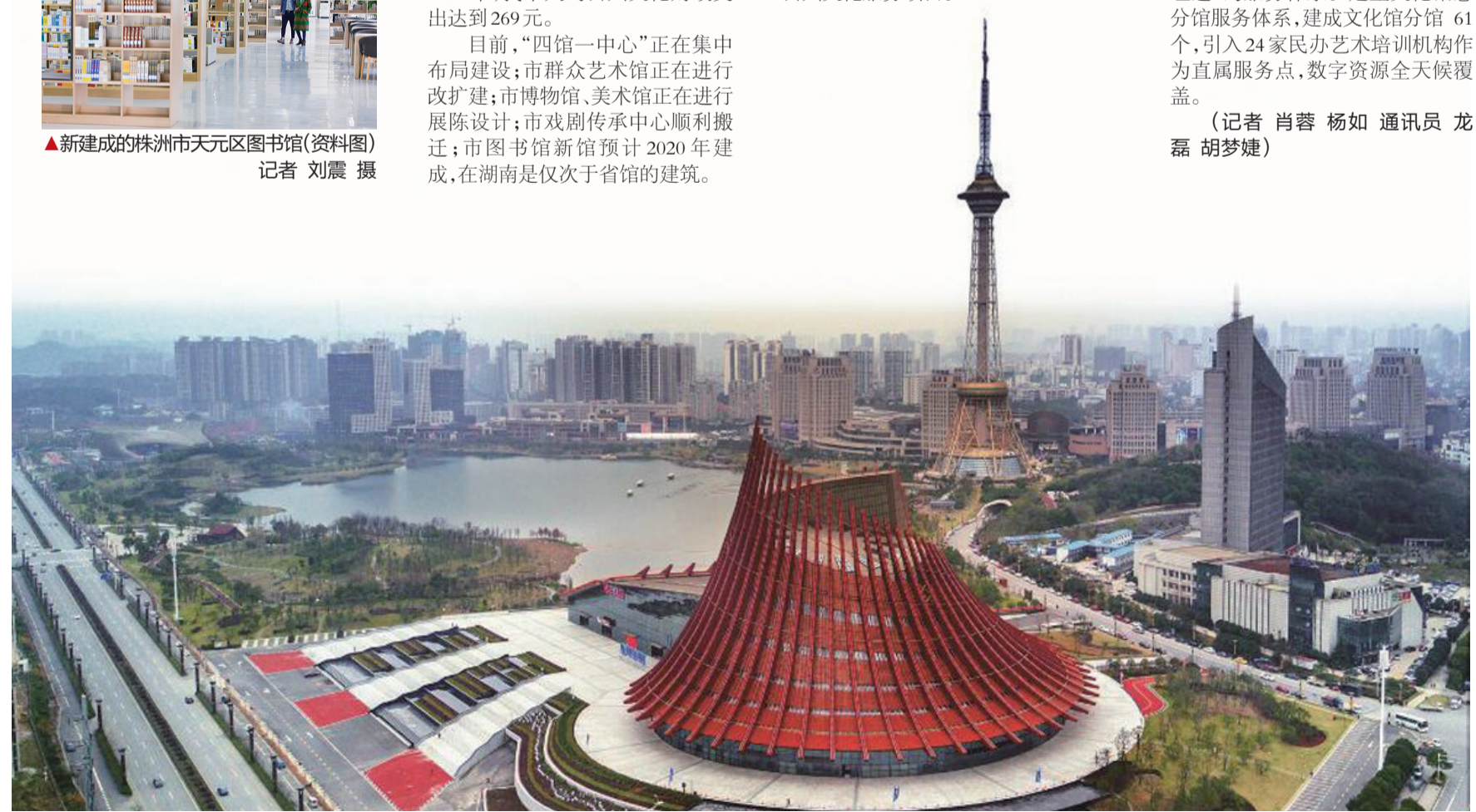
▲神农大剧院成为株洲文化地标(资料图)