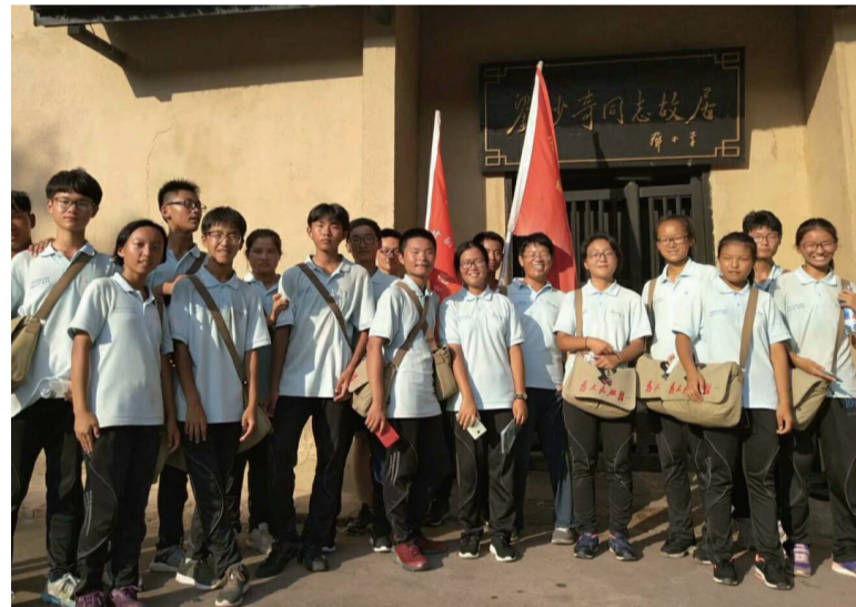
▲徒步的孩子们合影