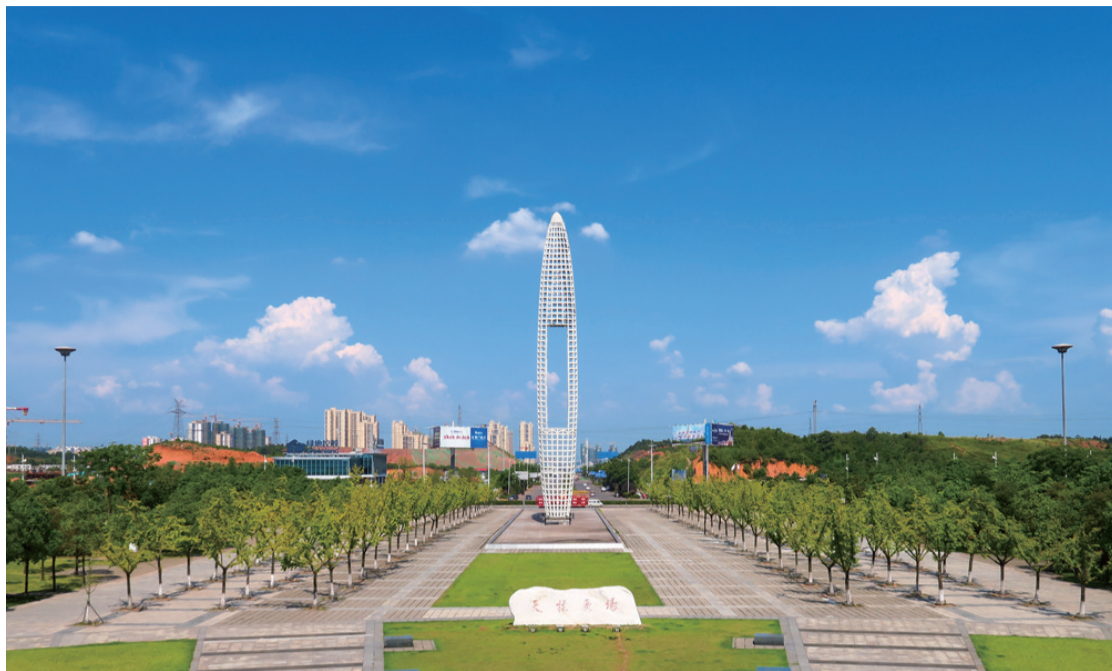
▲连续高温下的株洲,天空格外蓝。图为昨天的高铁株洲西站站前广场