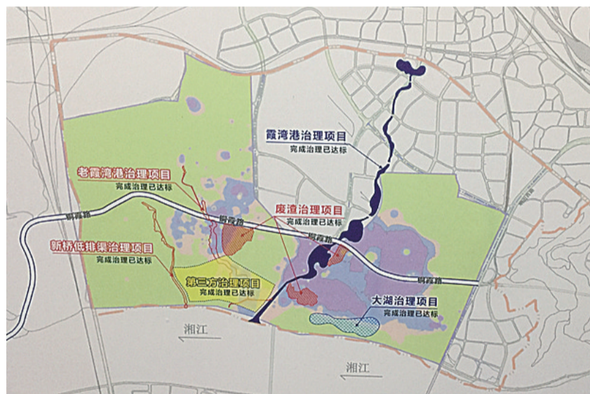
▲清水塘老工业区污染治理完成情况

清水塘老工业区企业关停搬迁已近尾声,清水塘生态科技新城建设已启动。近日,记者从清水塘投资集团获悉,今年上半年,该片区污染治理、基础设施建设、产业项目招商等工作都取得了积极进展。