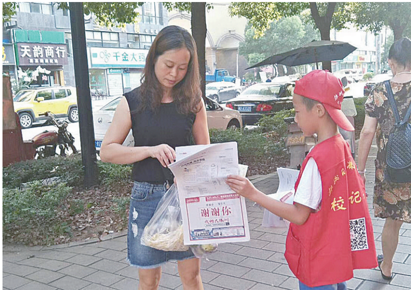
▲小报童在售卖株洲晚报