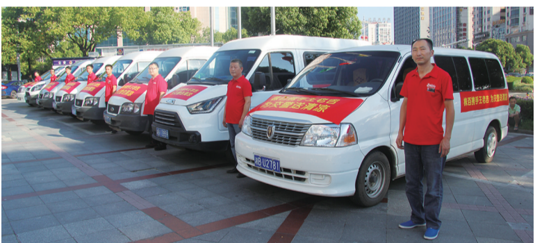
▲满载清凉物品的车辆整装待发

炎炎夏日,谁是烈日下最可爱的人?7月26日上午,爱心企业株百携手供应商广药王老吉,为市区7个交警大队,送上了1000箱王老吉解暑清凉,感谢他们为广大市民的出行保驾护航。