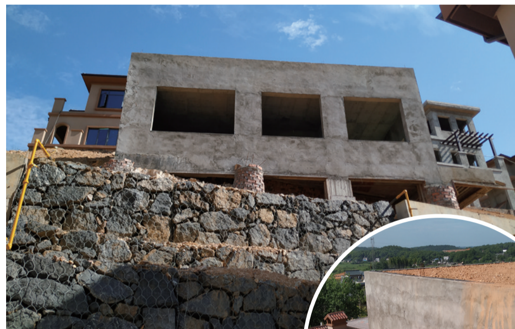
▲A区玲珑墅6号别墅业主私自建的房子 ▶一道台阶连接私自建的房子