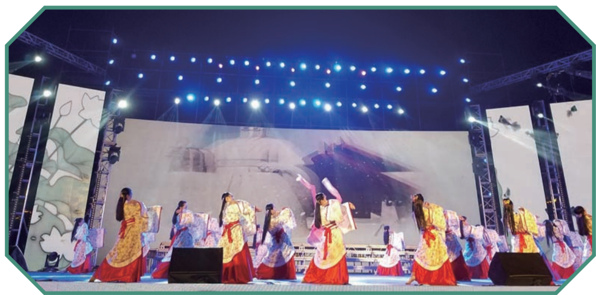
▲2016中韩青少年交流联欢晚会——“景弘之夜”活动现场 资料图

第八届中韩青少年国际文化交流活动即将于本月底拉开序幕,这是我市和韩国抱川市的传统文化交流项目。今年的活动由市旅游外事侨务局主办、株洲市景弘中学承办。