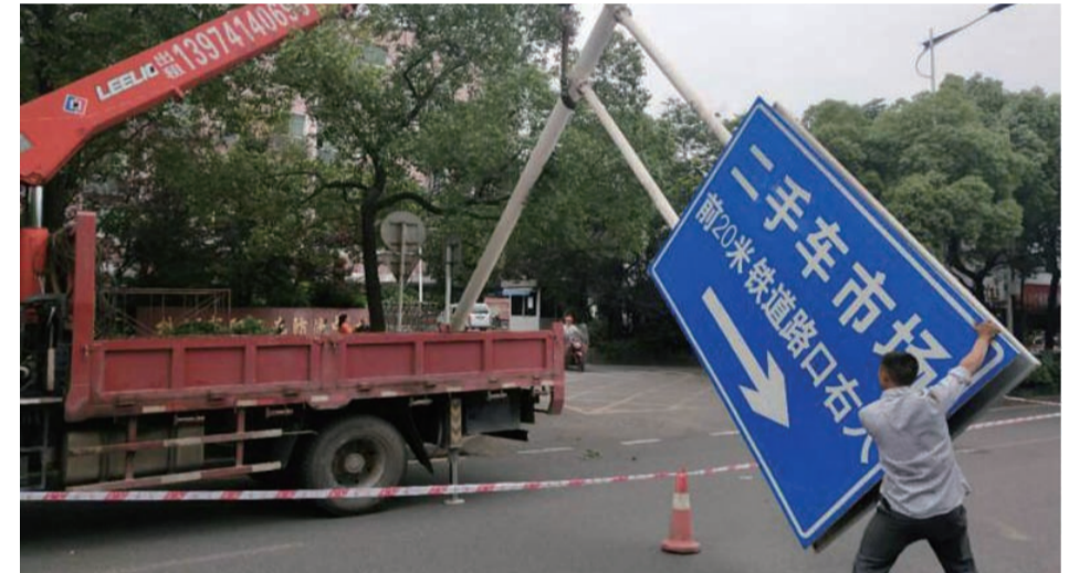
▲本月,荷塘城管大队组织拆除不符合规定的仿交通指示牌

本报讯(记者 伍靖雯 通讯员 城关)城市的规划建设和管理,要跟上时代的步伐。7月21日,株洲城市户外广告和牌匾控制规划专家论证会召开,多位专家就《株洲市城市户外广告和招牌控制规划(2018-2035)》(下称《控规方案》)进行研究讨论,提出良策。