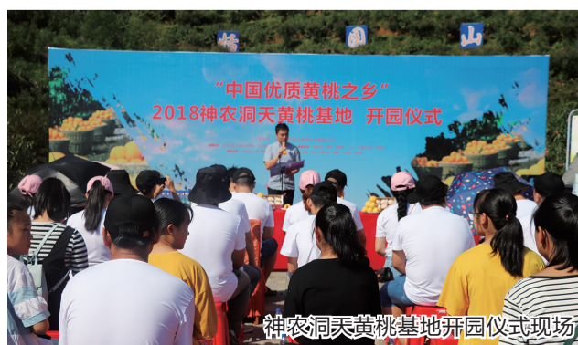
神农洞天黄桃基地开园仪式现场