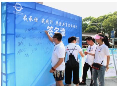
▲昨日活动现场,市民踊跃签名

本报讯(记者 贺天鸿 通讯员 刘再武 刘东)昨日上午,2018年株洲市食品安全宣传周启动仪式在市规划展览馆前坪举行。