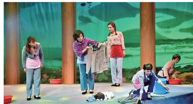
▲攸县原创花鼓戏《长辈》剧照

本报讯(记者 肖蓉 肖捷 通讯员 胡艳红)今晚8点,攸县花鼓剧团带来的大型花鼓戏《长辈》,将在市戏剧传承中心周末剧场(红旗广场东都酒店后)举行首演,21日至24日晚还将同一地点连续放送4场,市民可免费领票观看。