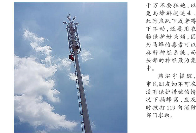
▲消防员正在爬塔救援