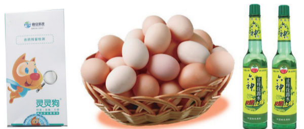
今日上午,相约市规划展览馆,奖品有限,不要错过!

其中,上午9点半在市规划展览馆前坪开展的互动问答活动准备了100份食品安全问题,市民答对问题即可领取奖品。奖品包括鸡蛋、驱蚊水、灵灵狗农药残留速测卡。食安小课堂活动则将以生动有趣的课程形式,引导孩子树立健康饮食观念。家长与孩子食安小课堂上,可以亲自动手做实验,增添亲子互动的乐趣,同时锻炼孩子的动手能力,让其成为家庭中的食品安全小卫士。