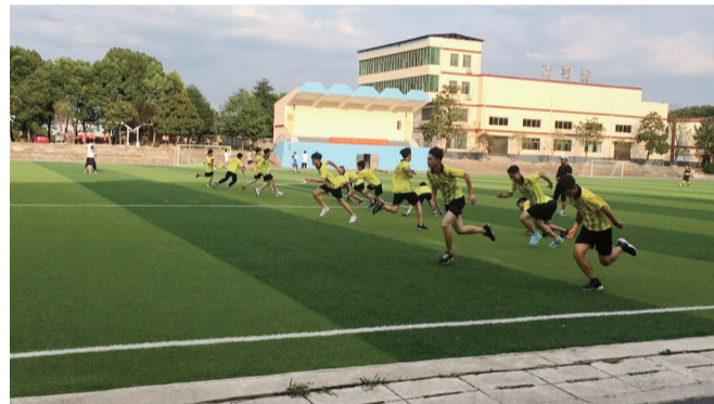
接受培训的学生在进行体能训练

本报讯(记者 何春林 通讯员 侯文波 实习生 文香雅)7月17日上午,55名爱好足球的学生在荷塘区外国语学校集合,6天的封闭式足球裁判培训正等着他们。