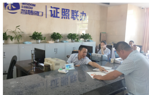
▲群众在一个窗口就能办理部分关联证照

本报讯(记者 戴凇 通讯员 熊军)政务服务“最多跑一次”,手机APP也能办业务。昨日,“智慧录口”项目(一期)上线运行,株洲县群众办事将更加便捷。