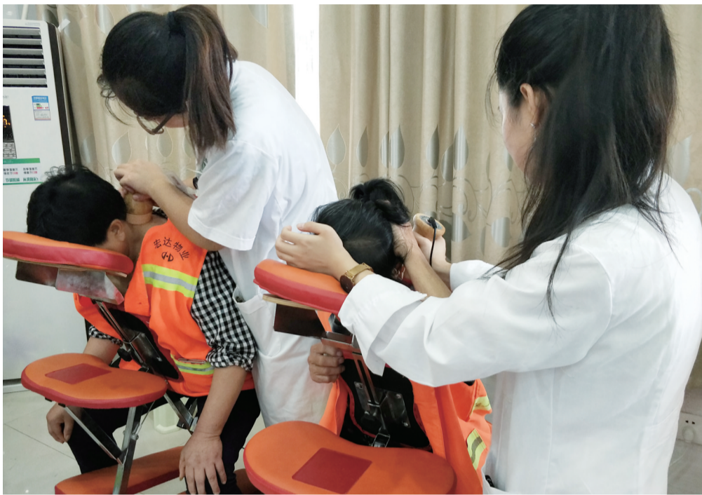
▲环卫工人正在接受免费理疗服务

在“旅游+工业”方面,株洲拥有得天独厚的优势,中国动力谷展示中心、中车时代电动等单位企业,也已经在工业旅游方面试水。比如中国动力谷展示中心开放的半年多时间内,已完成团体接待近800批次(包括公务及招商接待、研学团队和散客团体参观),散客参观近万人次。业内人士表示,株洲可借助此次政策支持,加速推动工业旅游发展。