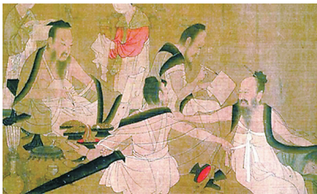
▲宋摹本《北齐校书图》局部,现藏美国波士顿美术馆

如同夏衣一样,扇子也是古人必不可少的“夏日伴侣”。扇子的起源很早,目前考古发现最早的扇子是湖北江陵拍马山砖厂一号战国墓出土的短柄竹扇。除了竹编外,制作扇子的材料还有丝绸、纸张、蒲葵、芭蕉和羽毛等。汉代出现了丝绸制作的团扇,成书于汉代的《西京杂记》还记载了一种七轮扇,“连七轮大皆径丈相连续。一人运之,满堂寒颤。”宋代折扇由日本传入我国,到明代广为流行,人们手里摇着一把考究的折扇,成了身份的象征。