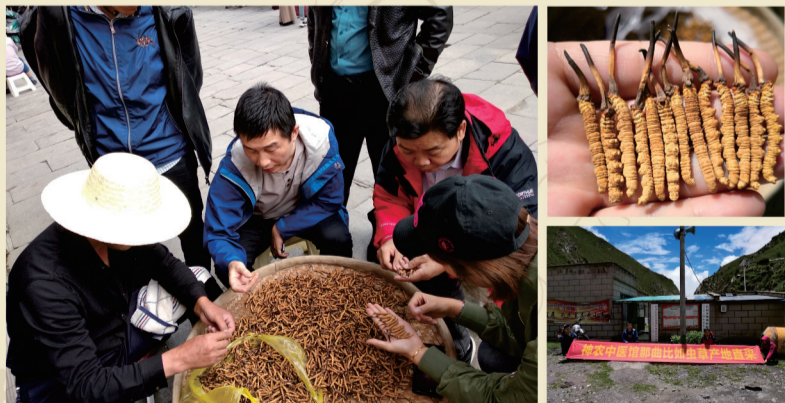
图:神农中医馆工作人员前往西藏那曲虫草产地直采