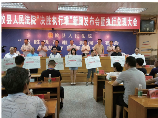
▲ 执行兑现大会现场

据悉,今年以来,攸县法院发布失信被执行人名单396人,限制高消费983人,罚款45人,司法拘留85人,以涉嫌拒执移送公安立案5人。执行兑现大会涉及的45件案件包括金融借款纠纷案件20件,合同纠纷案件20件,财产损害、劳动争议等涉民生案件5件,为15名申请人发放金额3911万元的转账支票,对11名申请人现场发放44.2万元现金兑现款。其中最大的一笔兑现款1200万元,最小的一笔兑现款1.4万元。