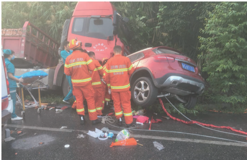
▲ 两车相撞,女司机被困,消防正在救援 消防供图

本报讯(记者 刘玺)前日,106国道攸县境内,一辆红色小车与一辆半挂车相撞,小车一头“扎”进挂车车头底部,还好女司机及时缩头,逃过一劫。