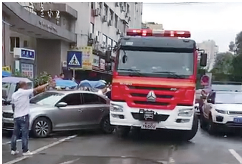
▲右侧又碰上了另一辆停在路边的小车

伴随着一阵急促的警报声,一辆消防车刚蹭了两辆违停堵塞消防通道的私家车,并将其“顶开”,随后前往火灾现场驶去。