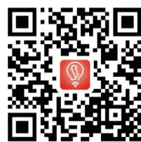
▲安卓手机 请扫码下载智慧株洲

株洲晚报爱心热线:28829110 短信或微信:13873320022 市教育局咨询热线:22663680