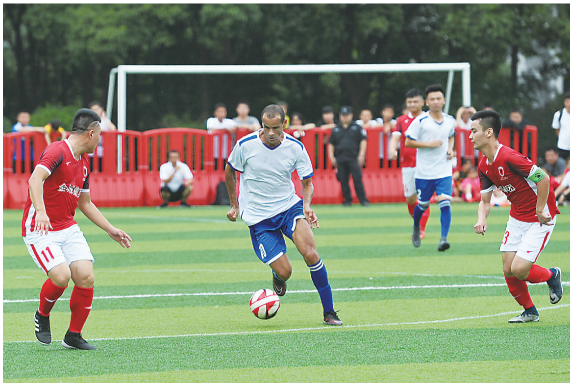
▲足坛名宿里瓦尔多在株洲参加足球友谊赛活动

本报讯(记者 伍靖雯 通讯员 周谭清)和世界足球先生、巴西传奇巨星里瓦尔多同场竞技,是何感觉?“过瘾!真过瘾!”昨天,2018“我爱足球”中国足球民间争霸赛株洲赛区现场,株洲的足球爱好者们如此说。