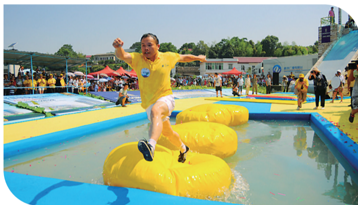
▲“穿越荷塘”历年活动照(资料图)

夏季旅游节期间,各县市区也将推出一系列的旅游文化活动(具体见相关链接)。此次旅游节由市旅游外事侨务局、荷塘区人民政府共同主办,荷塘区文化体育和旅游局承办。