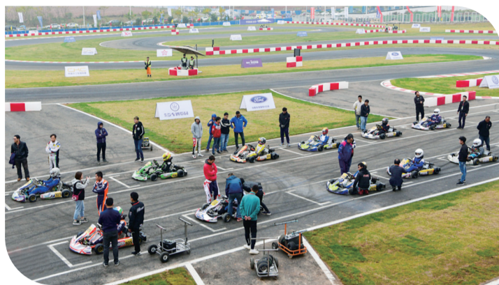
▲株洲国际赛车场卡丁车体验活动