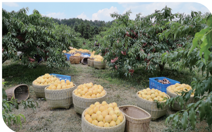
▲炎陵县黄桃大丰收