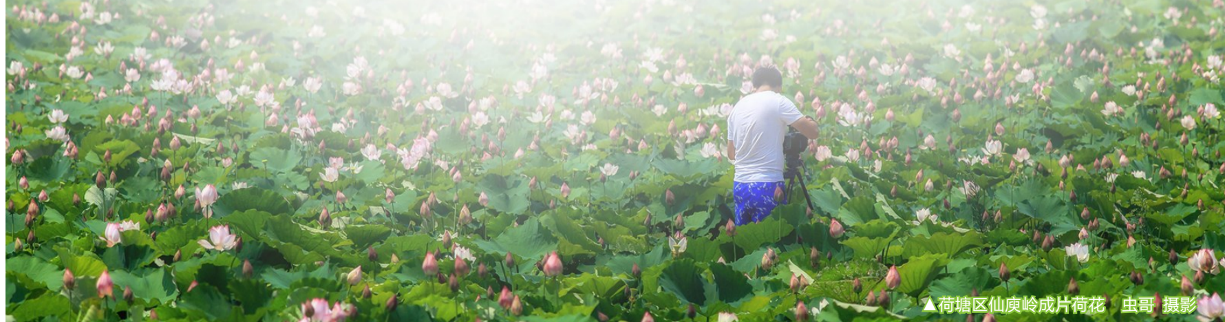
▲荷塘区仙庾岭成片荷花

乡村旅游节又是推进富民强民的重要途径。举办旅游节,归根结底就是要将旅游红利转嫁到人民大众身上,让老百姓得到“真金白银”。比如,炎陵、茶陵等贫困县,通过开展乡村旅游,使贫困户真正受益。