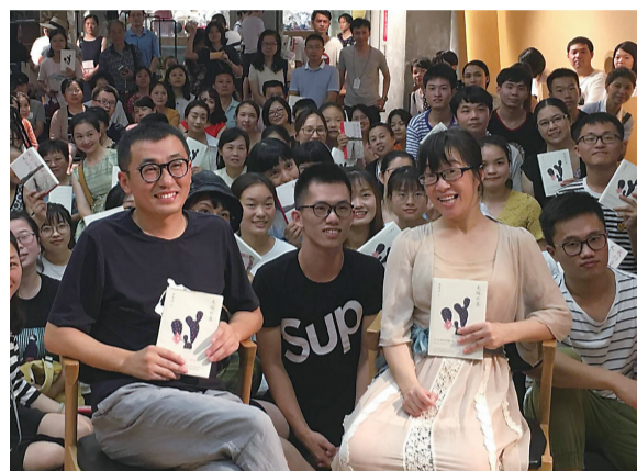
▲余秀华(前右一)和株洲读者在一起

2014年底,余秀华的一首《穿过大半个中国去睡你》,一夜之间红遍网络;2017年,她的纪录电影《摇摇晃晃的人间》被文艺青年在各大影院点映;央视《朗读者》节目里,她一袭布衣,摇摇晃晃地朗读诗歌《给你》,震动了镜头前的无数男女……7月1日下午,著名诗人余秀华携新书《无端欢喜》作客株洲。