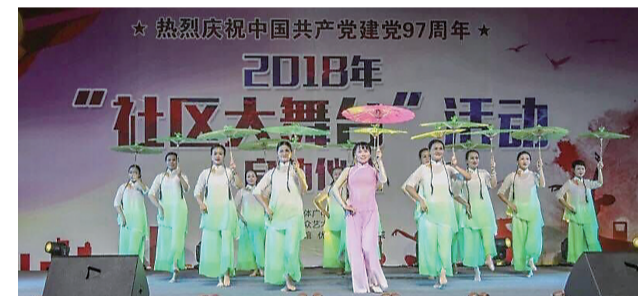
▲活动现场表演

本报讯(记者 蓉蓉 通讯员 杨颐珠)为庆祝建党97周年,丰富群众文化生活,6月30日晚7点半,2018年“社区大舞台”活动在神农城启动。