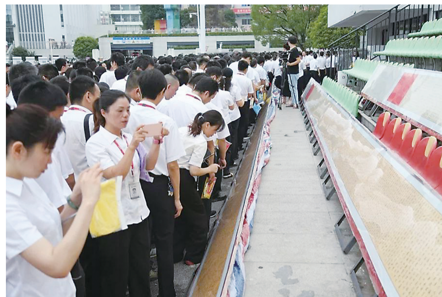
▲中车株机员工现场欣赏“十九大”报告书法作品

本报讯(记者 高玲 通讯员 刘天胜)昨天上午,中车株机公司举行“七一”升国旗、重温入党誓词”主题活动,庆祝建党97周年。现场,由中车株机公司转向架事业部3名员工手书的71米(隶书)、82米(行书)、97米(行草书)“十九大”报告全文,首次完整露出真容。