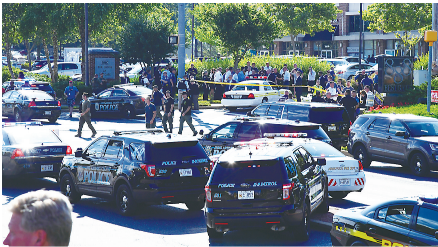
▲警方封锁枪击事件现场

美国东部马里兰州一家报纸的编辑室28日下午发生枪击事件。当地警方说,枪击事件已造成5人死亡,另有2人受伤。