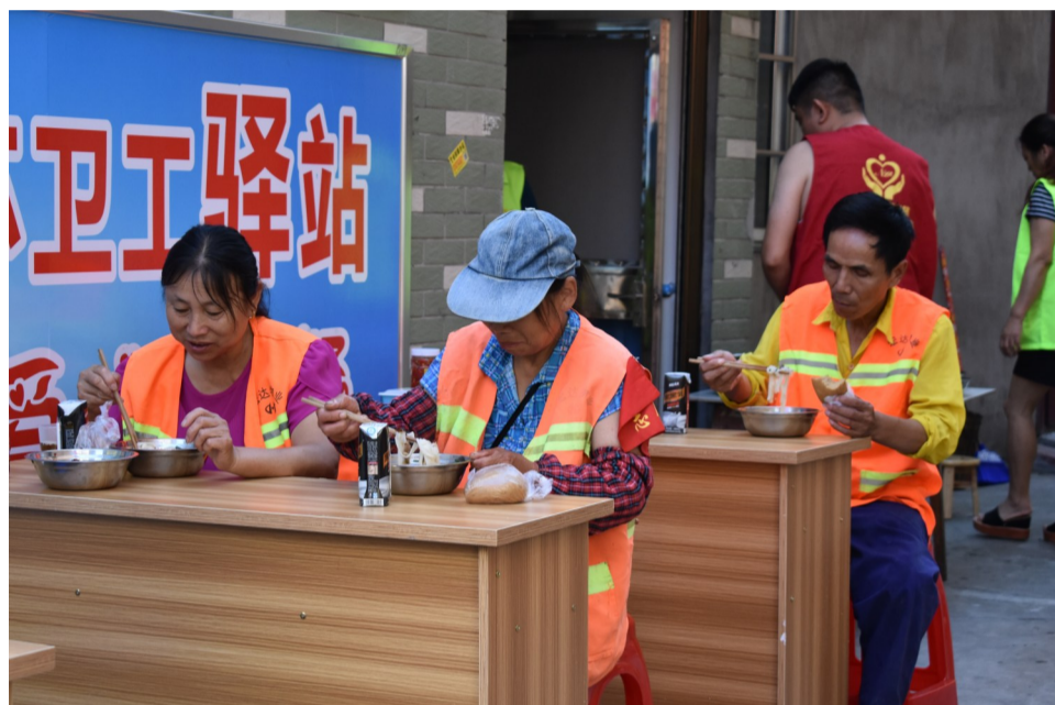
▲环卫工在驿站吃早餐

本报讯(记者 高玲)昨天,株洲县环卫工驿站正式营业,免费向在附近街道当班的50名环卫工人提供早餐、茶水、常备药品、书报阅读及休息场地。该驿站由株洲县县委宣传部、县委组织部、县总工会牵头组织,株洲县环卫处投资修缮,株洲县博爱义工联合会运营。