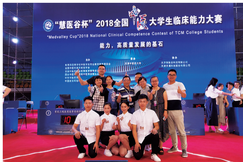
学生参加2018年全国中医大学生临床能力大赛