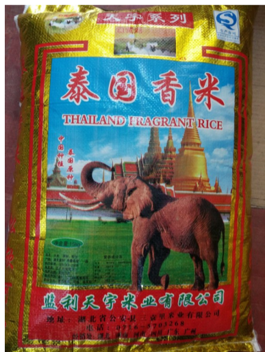
▲冒用厂名、厂址的大米包装

工商部门提醒,类似冒用厂名厂址的产品,不仅侵害正规厂家利益,产品的质量也没法保证。消费者在购买大米时,要留意产品外包装,对