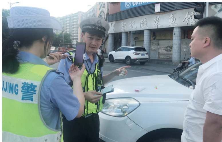
▲荷塘交警正在辖区进行“微直播”

本报讯(记者 刘望 通讯员 管丽)昨日下午,荷塘交警在辖区开展“世界杯”行车安全提醒微直播,通过这种方式让更多的司乘人员提高文明交通安全意识。