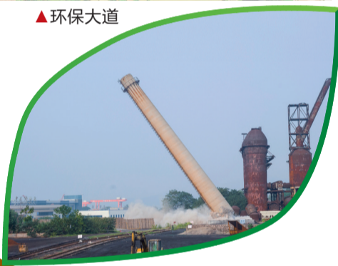
▲钢厂最后一根烟囱倒下