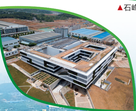
▲中车株洲电机研究院