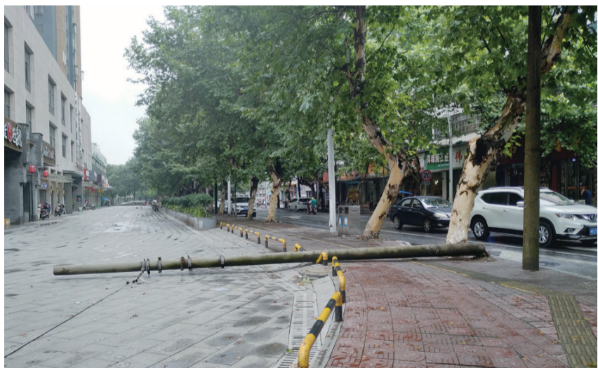
▲倒地的电线杆

昨日,有市民拨打晚报新闻热线28829110反映:6月19日下午,芦淞区人民路和纺织路交叉处的人行道上,一根电线杆断了,倒地上三天一直没人管。