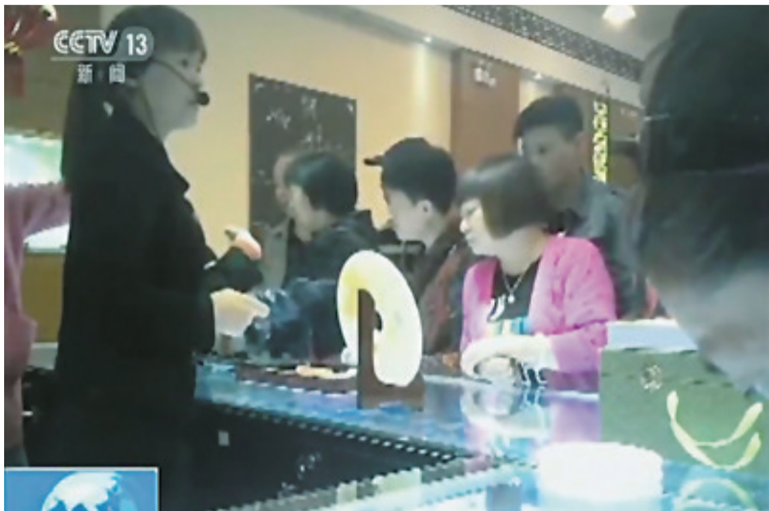
▲6月15日,央视“新闻直播间”节目中,游客在珠宝首饰店内选购商品(视频截图)

近日,央视“新闻直播间”播出不合理低价游调查引发关注,内容涉及云南多个旅游景区。