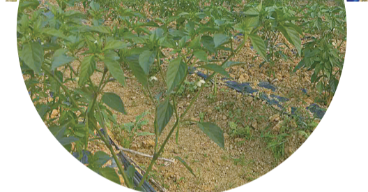
▲今年的辣椒苗已开出白色的小花,下个月就会有收成

去年她带着产品参加2017中国食品餐饮博览会,还通过与电商平台合作,将产品销到了四川、广州、浙江、北京等地,“每次去这些餐馆,吃到‘熟悉的味道’,都觉得自己特别幸福。”