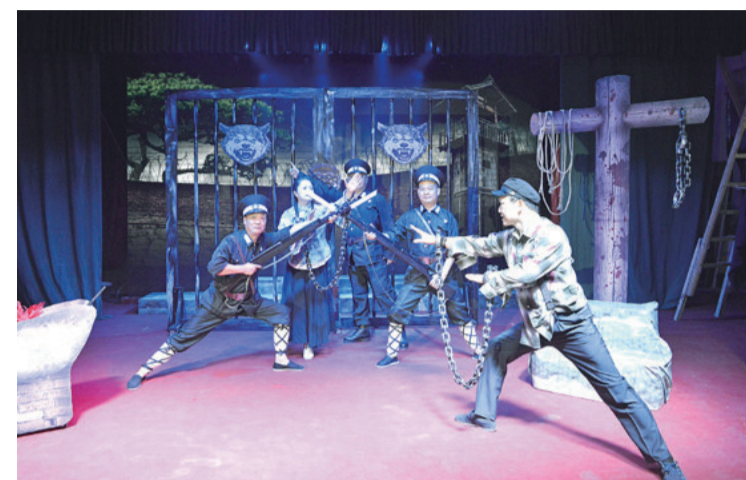
花鼓戏《热血》演出照

新兴医院公租房配套基础设施项目(新文化路);南岳岭片区棚改安置房配套基础设施项目;莲花社区保障性住房配套基础设施项目;云龙总部经济园公租房配套基础设施建设;保障性安居工程奖励项目完成公示,我市共有21个项目上榜,列入中央预算内投资计划。株洲此次上榜的21个项目,是根据自身实际及轻重缓急,提出与保障房小区配套的水电路气、污水处理、垃圾处理、停车场、教育和医疗卫生等建设项目,覆盖荷塘、云龙、石峰、醴陵、攸县、炎陵等多个县(市)区。