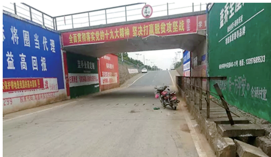
▲图为事故现场

本报讯(记者 肖捷)近日,茶陵县公安局交通警察大队发布一条悬赏消息,凡是能提供有效破案线索的,可获得1万元奖励。