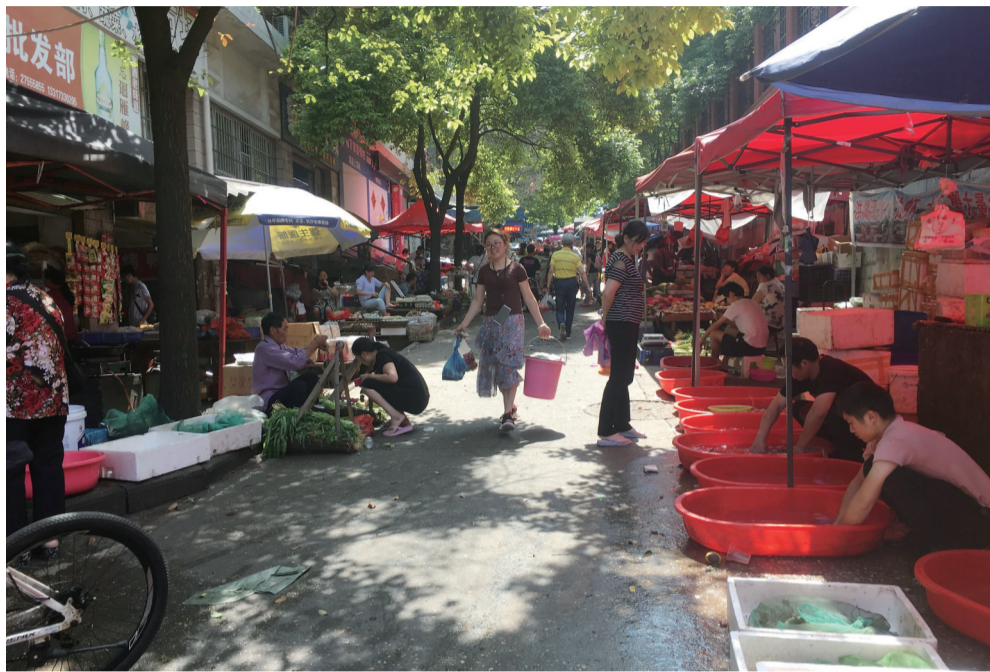
▲马路两边,店铺搭起帐篷出店经营