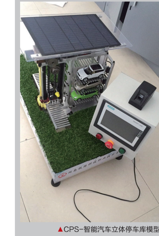
▲CPS-智能汽车立体停车库模型