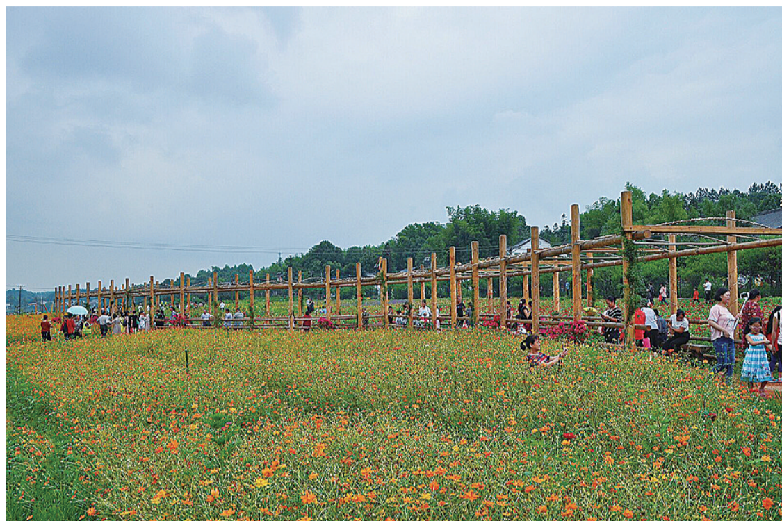
▲昨天下午,天元区响水村花海吸引了不少游客