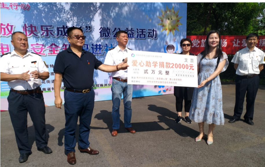
▲图为湖南省特种设备检验检测研究院捐款2万元现场

本报讯(记者 姚时美 通讯员 谭泉海)前日上午,一场公益活动在荷塘区新苗路银杏庄园进行,3家单位为赵家冲社区“春蕾爱心屋”的儿童捐款捐物3万元。其中,湖南省特种设备检验检测研究院捐款2万元,湖南省特种设备检验检测研究