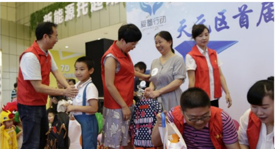
▲市爱心志愿者联合会代表中华儿慈会为4名儿童颁发“圆梦红包”

6月10日,天元区“爱蕾行动”公益活动启动仪式在神农城广场电视塔一楼大厅举行,社会各界爱心人士近400人出席。活动由天元区人民政府联合多家单位及爱心企业共同举办,是天元区政府落实“党