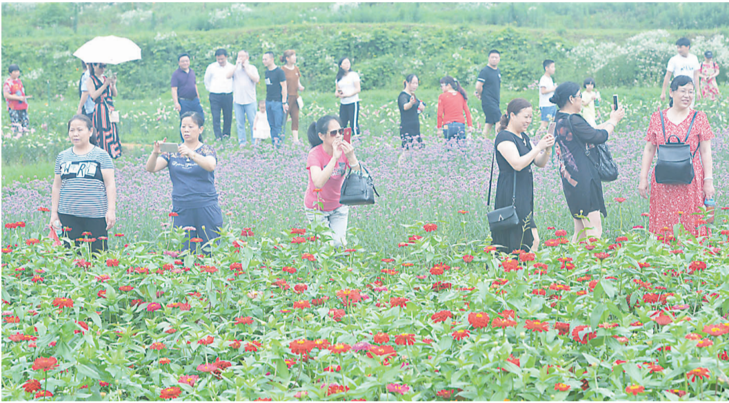
▲艺术节开幕当天,吸引了不少市民前往赏花

本报讯(记者 伍靖雯 通讯员 徐洋 李欣毅)上周六,天元区第二届乡村文化旅游节暨第二届响水百花艺术节开幕,活动的主题是“绚彩新响水·情定石三门”,当天游客量超过3000人次。