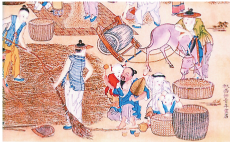
▲清代天津杨柳青版画《庄家忙》描绘的“麦口天”农忙场景,过去农民要纳“田赋”