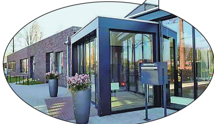
▲整个温暖小镇只有一个大门可供出入