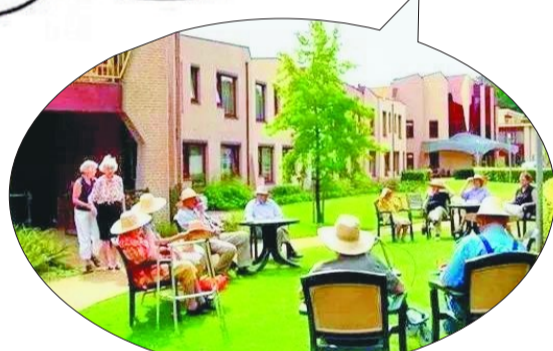
▲老人们在草地上聚会交流