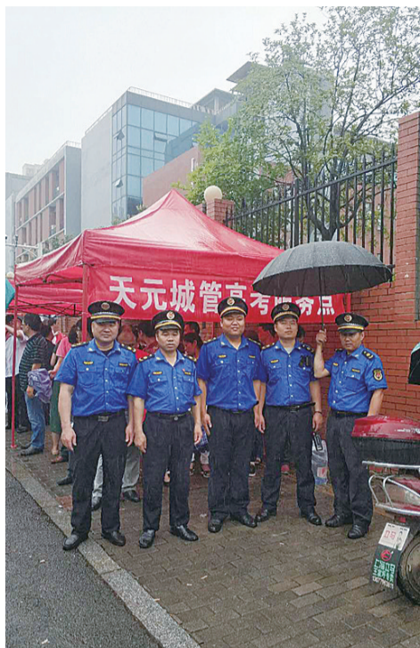
▲天元城管队员在市二中考点外为家长支起雨棚

记者获悉,这两天,全市各个考点外都设有城管部门的爱心服务点,及时为考生及家长服务。