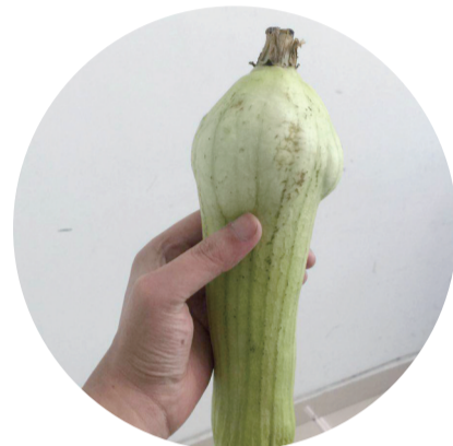
▲张先生买的丝瓜，一端浮肿，一端干瘪

昨日，家住河西的张先生拨打晚报新闻热线28829110反映：上周末，我在中南蔬菜批发市场买了4条丝瓜，在家存放一些时间后，丝瓜发生了奇怪的变化，我怀疑这些丝瓜被注射了激素。