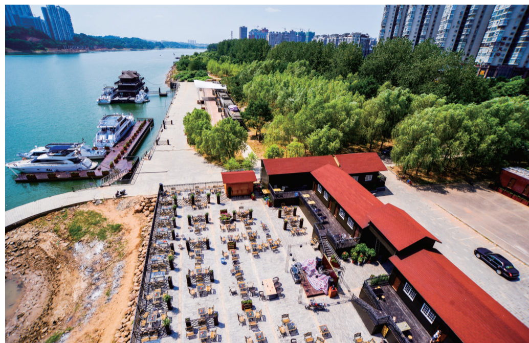
▲河西风光带湘江水上旅游服务中心