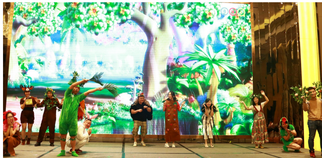
▲不一样的“六一”,家长为孩子表演戏剧

本报讯(记者 杨如)“看,台上那个漂亮的水母是我妈妈!看,那只霸王龙是我爸爸,很酷吧!”坐在小椅子上的孩子们一边欣赏节目,一边议论着。5月31日上午,一场别开生面的戏剧表演在万豪酒店上演。