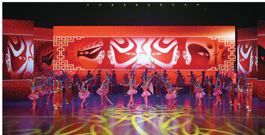
▲荷塘区专场舞蹈《小梨花》