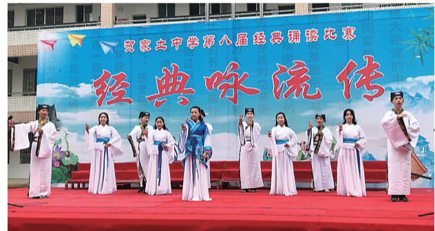
5月23日下午,在贺家土中学的操场上,“经典咏流传”第八届书香校园经典诵读大赛如期举行。

学校负责人表示,举办书香校园经典诵读大赛的目的是在校园里弘扬中华优秀传统文化,增强师生的人文底蕴,提高学生综合素养,大力营造书香校园,在学校里形成热爱读书的良好风气,进而为提高教学质量打下坚实基础。