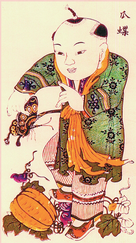
▲清代山东平度版画《瓜瓞富贵》之“瓜瓞”,男孩手拿蝴蝶,脚踩瓜果

蝴蝶还是长寿的化身则与“蝴蝶”一名有关。古称八九十岁为“耄耋(mào dié)”,耄与“蝶”谐音,蝴蝶因此成为传统吉祥图案长寿元素。“蝶”又与“廛(dié)”谐音,吉祥画“瓜瓞绵绵”绘的便是长丝瓜和蝴蝶;“瓜瓞富贵”,则是瓜、蝶、蝙蝠、桂花四物。