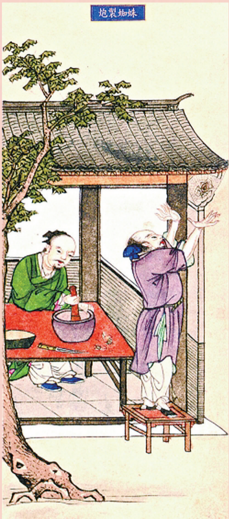
▲明代《补遗雷公炮制便览》插图“蜘蛛炮制”